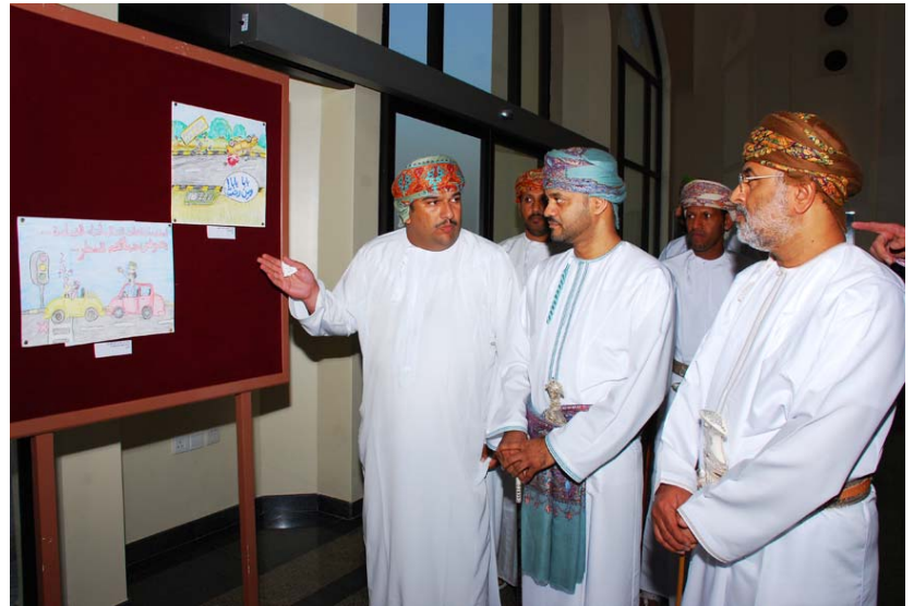
استعراض رسومات الطلاب

إن هذه المسابقة، التي تجري برعاية شل للتنمية عمان بالتعاون مع وزارة التربية والتعليم وشرطة عمان السلطانية، تعطي مثالا جيدا عن نجاح الشراكة بين الحكومة والقطاع الخاص، وتساعد الجيل الشاب على التمتع بحس المسؤولية في استخدام الطريق.