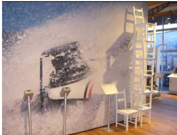
قطر: فولفو تعرض عدد من المقاعد للتذكير باستخدام حزام