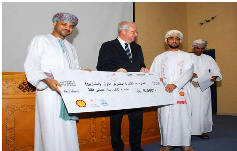
تسليم الجائزة للمدرسة الفائزة