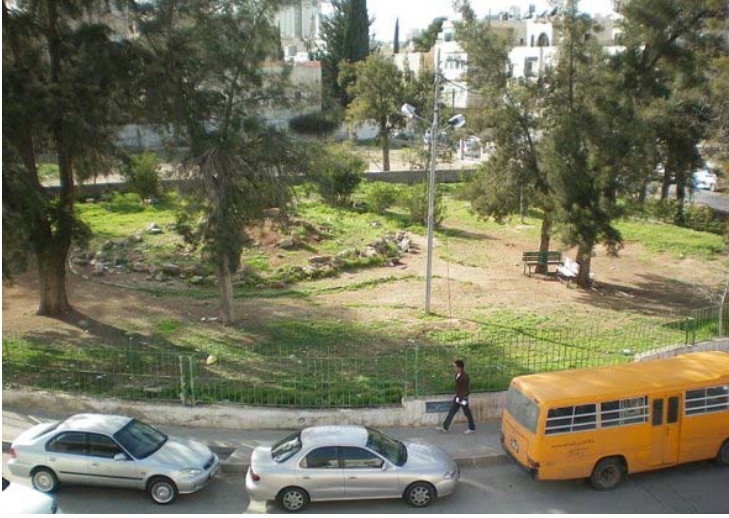
الحديقة قبل التأهيل

لمزيد من المعلومات يمكن زيارة: www.hikmat.org