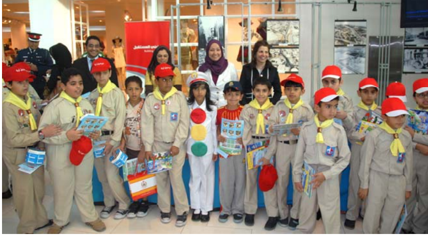
البحرين: الأطفال يشاركون في حملات التوعية