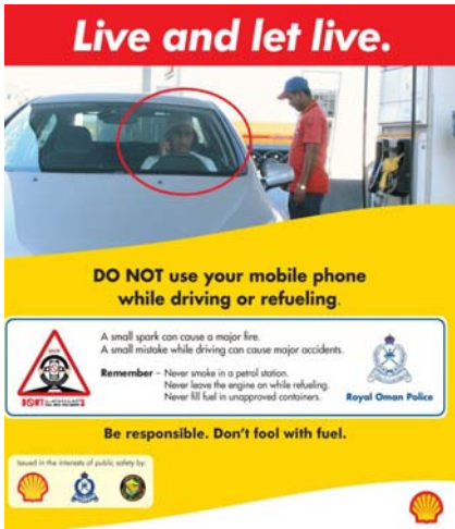
سلطنة عمان: ملصقات للتوعية ضد استخدام الهاتف النقال

عملت شركة فولفو الشرق الأوسط مع شرطة أبوظبي على إطلاق مسابقة للسلامة على الطرق. حيث دخل المساهمون الذين أجابوا بصورة صحيحة على الأسئلة المتعلقة بالسلامة الطرقية في سحب على سيارة فولفو. وقدمت شركة فولفو للشرق الأوسط سيارتين في هذا السحب لصاحبي الحظ السعيد: فولفو C30 و فولفو S40.