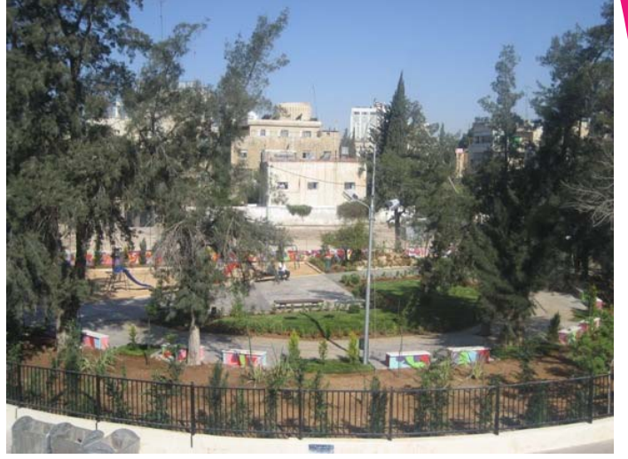
الحديقة بعد التأهيل